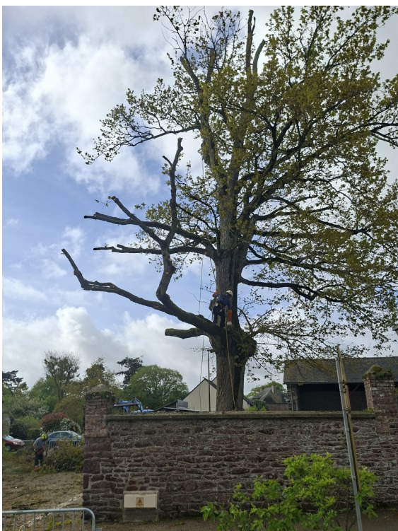
16 avril 2026 Abattage du 2 ème chêne