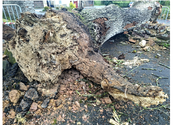
Samedi 4 avril 2026 le 1 er chêne est tombé.